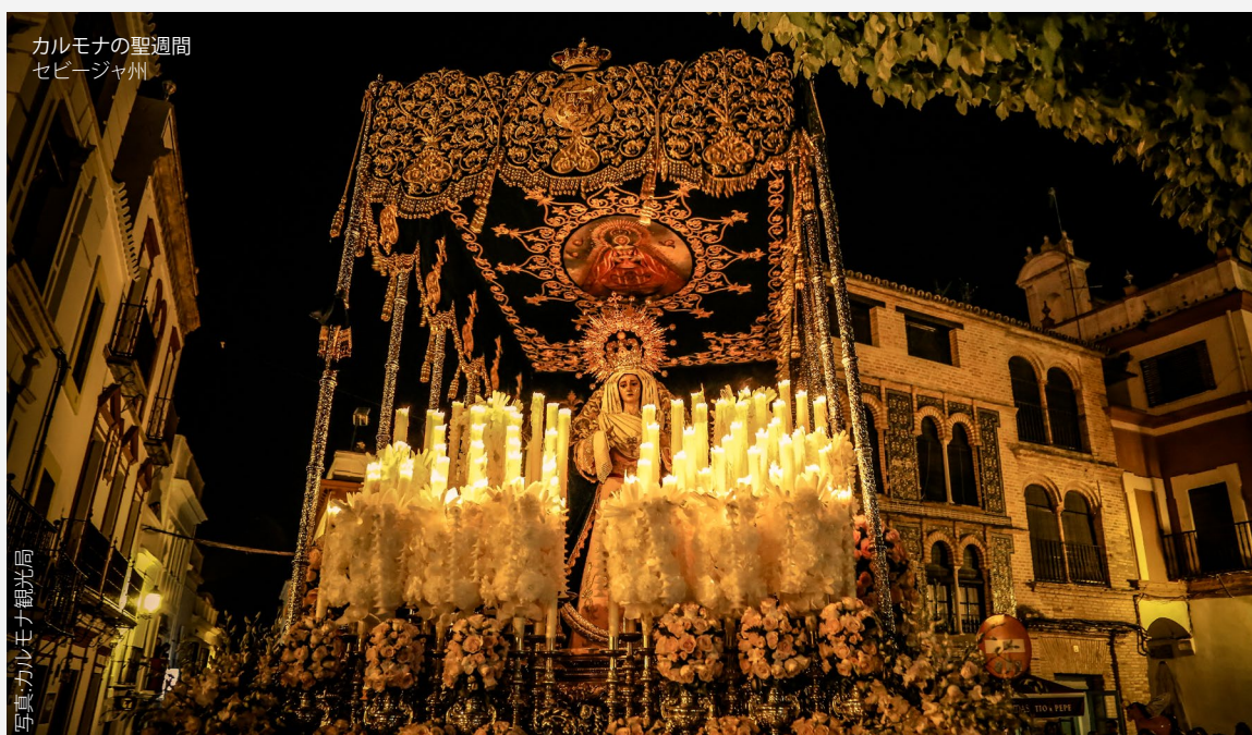
カルモナの聖週間 セビージャ州