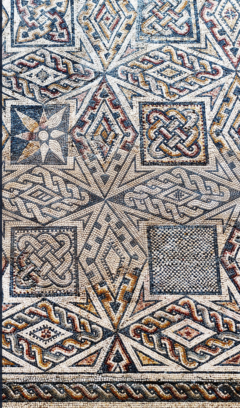
▲ ロマネスク様式のモザイク 国立古代ローマ美術館 メリダ

エクストレマドゥーラ州では、農園、葡萄畑、牧草地など、のどかな風景が見られます。ユネスコの世界遺産に登録されている、カセレスの旧市街やメリダの考古学遺跡群には驚かされることでしょう。カセレス県では、ユダヤ人街と狭く急な坂道で有名なエルバスや、二つの大聖堂、宮殿、貴族の邸宅など多くのモニュメントが見られるプラセンシアなど、魅力的な村に立ち寄るのをお忘れなく。エクストレマドゥーラ州のイベリコ生ハムは、スペインでも最高品質を誇ります。またバンニョス・デ・モンテマヨールのローマ時代の温泉施設でゆったりするのも良いでしょう。