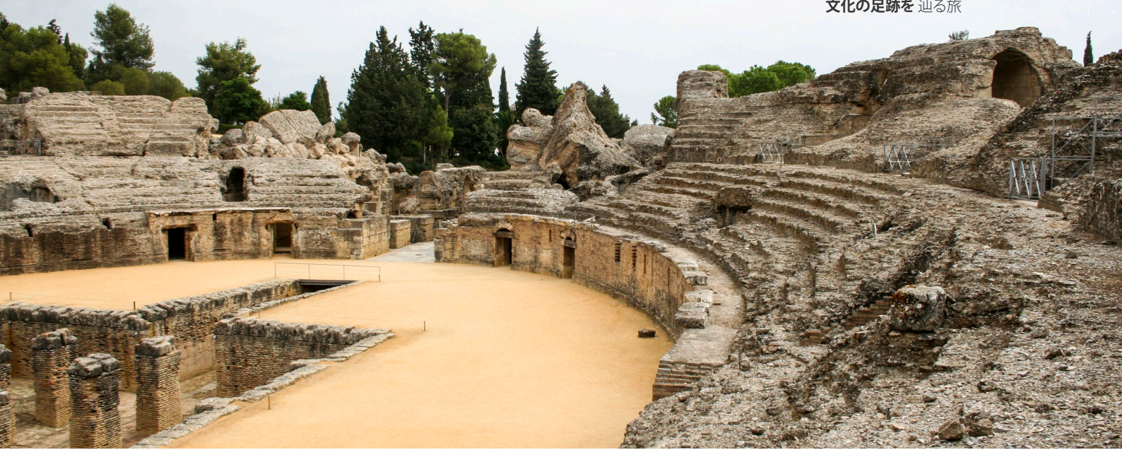
▲ イタリア古代ローマ円形劇場 サンティボンセ(セビージャ)

アルモラビデ朝とアルモアデ朝の道では、主に城や要塞など、これらの王朝文明が遺した遺産を目にすることができます。アルヘシラス(カディス県)を出発し、2本の支道を辿って終着地のグラナダを目指す400キロのルートです。ヘレス・デ・ラ・フロンテーラ(カディス県)やロンダ(マラガ県)などの街を訪れます。