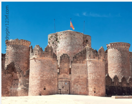
▲ ベルモンテ城 クエンカ

バジャドリのモタ城、ウエスカのロアレ城、コルドバのアルモダル・デル・リオ城など、スペイン各地には魅力的な城が点在しています。観光案内所で各自治体のおすすめルートを尋ねてみましょう。