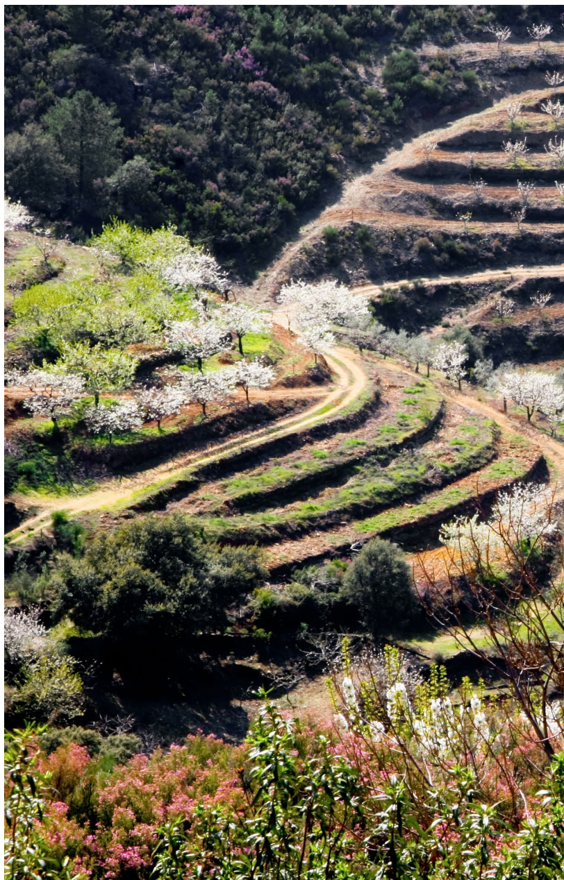
▼ ヘルテ渓谷 カセレス