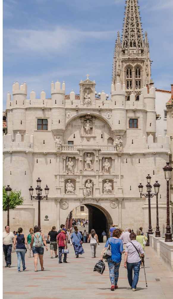
▲ サンタ・マリア門 ブルゴス

次にカステージャ・イ・レオン州に入りましょう。中世の面影を残す街、メディーナ・デ・ポマール(ブルゴス県)は、カール5世がひと晩過ごした場所として知られています。14世紀に建設された荘厳な城、アルカサル・デ・ロス・ベラスコも見ておきましょう。モニュメントの多いブルゴスでは、歴史あるサンタマリア門が市街地に向かう人々を出迎えます。門の内部に入ると、皇帝に