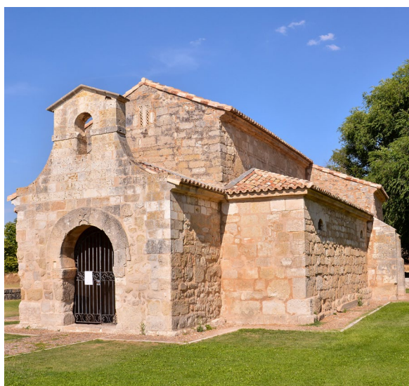
▲ サン・フアン・デ・バーニョス教会 ベンタ・デ・バーニョス(ブルゴス)