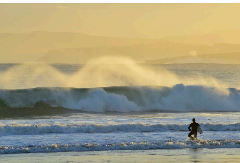
▲ ラレド カンタブリア州

ブリュッセルで退位後のカール5世の軌跡を辿るルートです。皇帝退位後、カール5世は50隻以上の船を率いてスペイン北部に到着。その後 カンタブリア州、カステージャ・イ・レオン州、エクストレマドゥーラ州 と廻り、最後は ユステ修道院で隠棲生活を送りました。