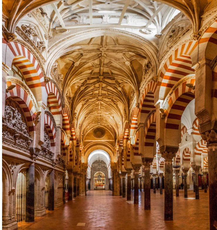
▲ コルドバのメスキータ コルドバ

毎年9月に開催される「ヨーロッパのユダヤ文化の一日」そして11月の「3つの文化が融合した中世市場」の本部が置かれています。