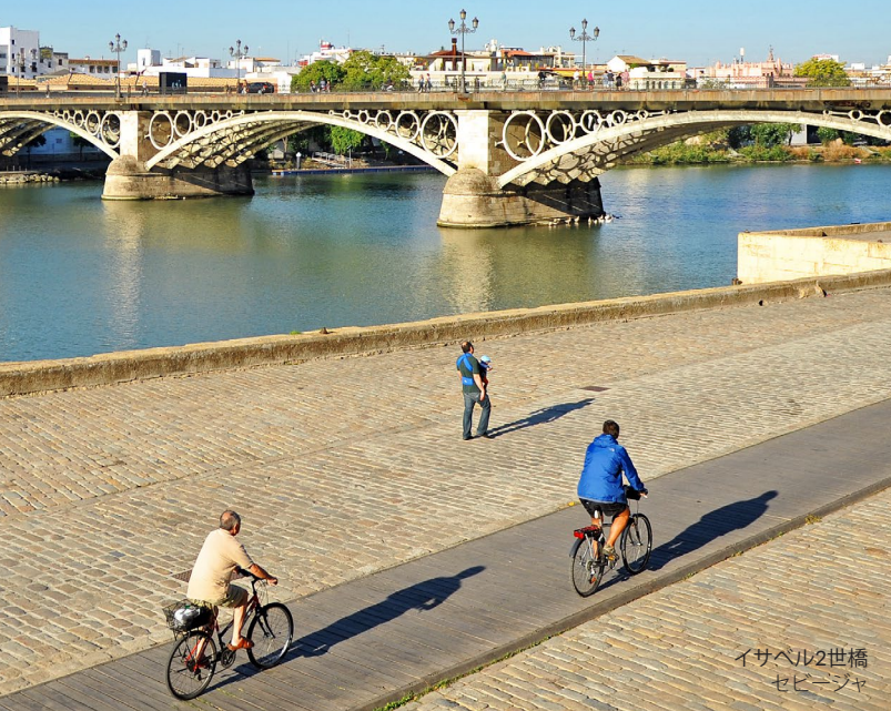
イサベル2世橋 セビージャ