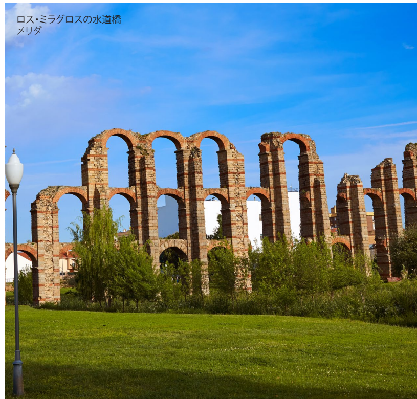
ロス・ミラグロスの水道橋 メリダ

城壁にぐるりと囲まれた カセレスの旧ユダヤ人街には、元々はシナゴグだったサン・アントニオ教会があります。城壁を壁にした石灰の白色が美しい家々が、狭く急な坂道に並ぶ光景には驚くばかりです。カセレスの旧市街はユネスコの世界遺産に登録されており、