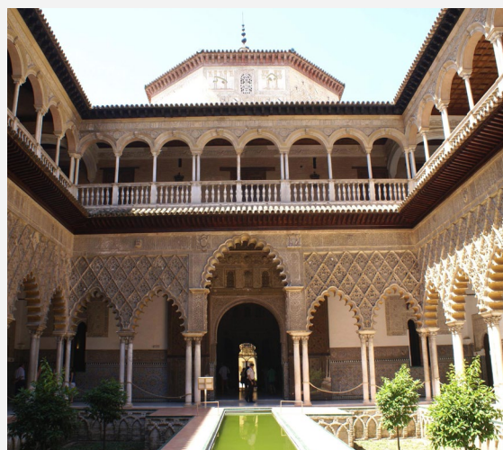
▲ セビージャのアルカサル 乙女の中庭 セビージャ

クエンカにあるベルモンテ城は、ルネッサンス様式建築物の至宝とされ、六芒星の形をした角にはそれぞれ塔が建っています。5月～6月には、城を舞台に中世の歴史を忠実に再現するイベントが開催されます。中世の軍事環境をあらゆる面から知ることのできる良い機会です。