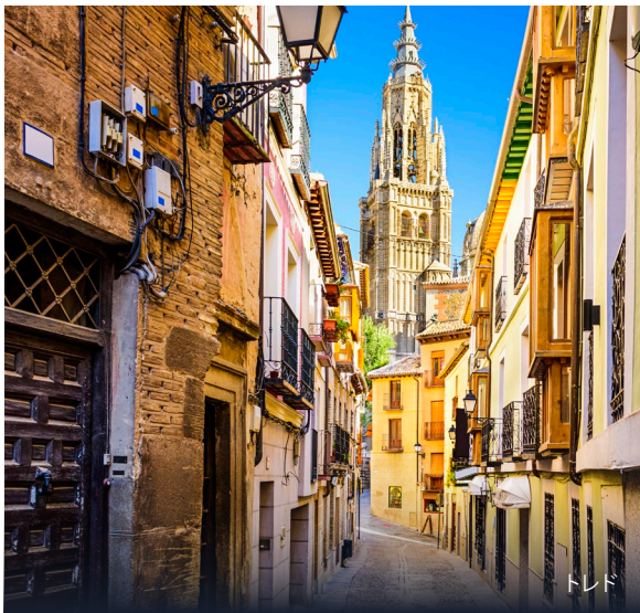
▶ セルバンテスの像 トレド