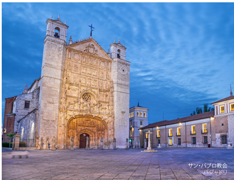
サン・パブロ教会 バンヤドリ