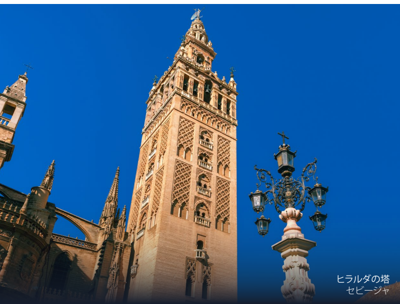
ヒラルダの塔 セビージャ

① www.legadoandalusi.es/las-rutas/ruta-de-washington-irving